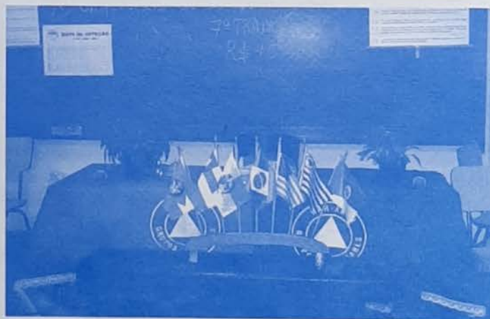
Vista parcial da sala de reunião

O Coordenador do Comitê informou que o Comitê foi criado no 2º semestre de 2004 e que até o final do exercício do ano de sua criação, as atividades de desenvolvimento técnico do novo site foram levadas a cabo e que o mesmo encontra-se em fase de testes e alimentação de conteúdo pelos comitês envolvidos, quando então seu conteúdo será apreciado pelo Comitê de N/D, em agosto e se aprovado, colocado no ar.