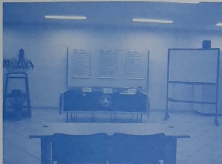
Atual composição da Junta de Curadores

É gratificante participar, com companheiros de diversas Áreas, de eventos que tratam da prestação de serviço em benefício da Unidade e Crescimento de nossa irmandade.